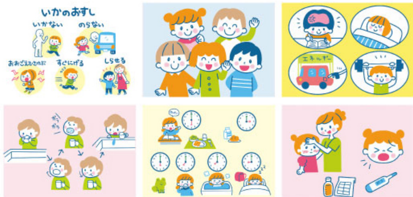
赤ちゃんとママ社「保育園の健康教育」付録教材