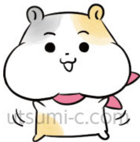
千連会ピンクリボンプロジェクト 「むねハムの乳がん“かんたん”セルフチェック」 キャラクターデザイン・グラフィック制作