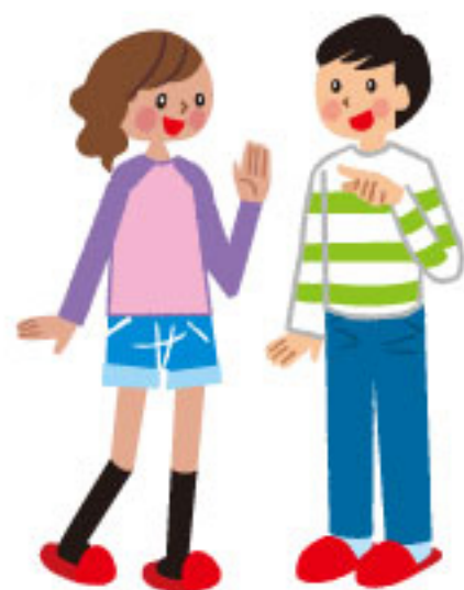
学研「小5英語がばっちり身につくレッスン」