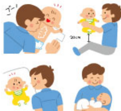
妊婦向けフリーペーパー「アネティス」