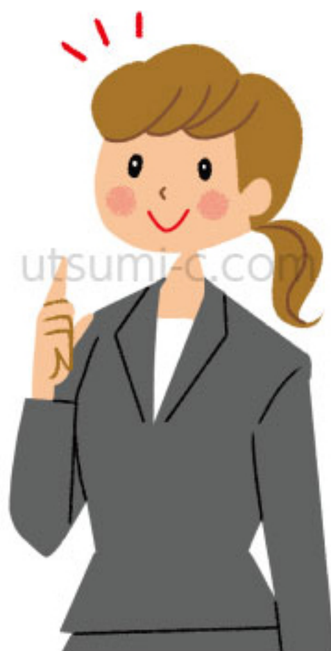
学研メディカル秀潤社 月刊「ナースング」リクルート特集イラスト