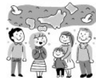
冊子コラムイラスト