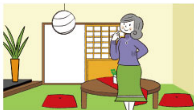
不動産会社 CM 動画用グラフィック制作