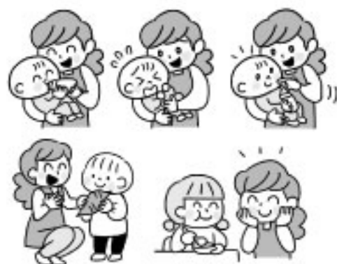
株式会社メイト「いただきます・ごちそうさま」