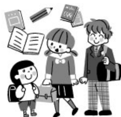
校成出版社「校成」 コラム「暮らしの中の憲法」