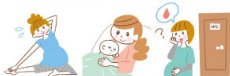
ナツメ社「安産のための骨盤ストレッチ」