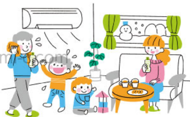
サンケイリビング「ぎゅって」広告記事