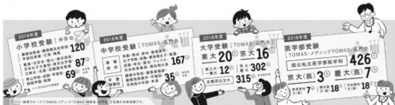
リーゼ教育 新聞広告