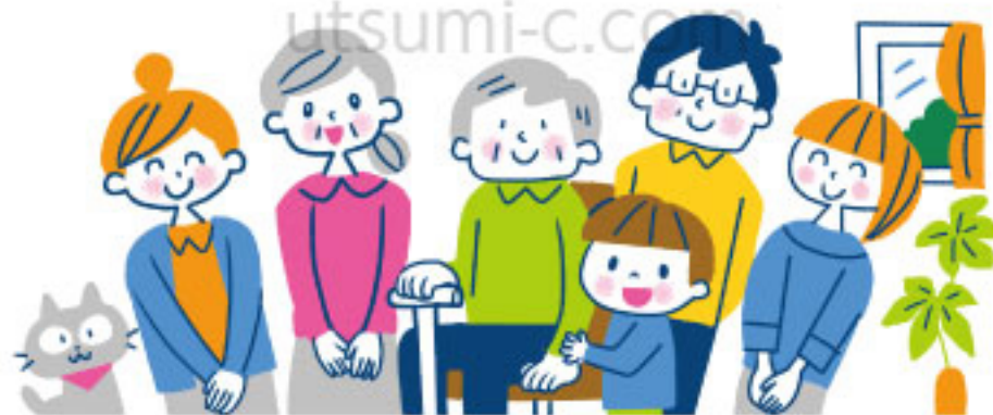
日本歯科医師会リーフレット