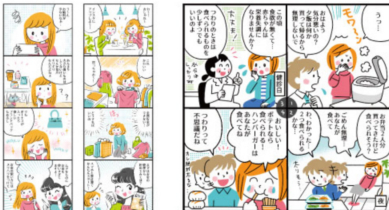
学研「FYITE」サイト「大人女子のマイルド野暮」4コマ