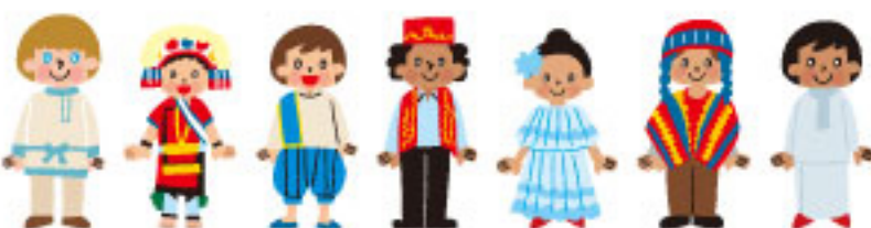
フレーベル館「全国姉妹都市巡鑑」