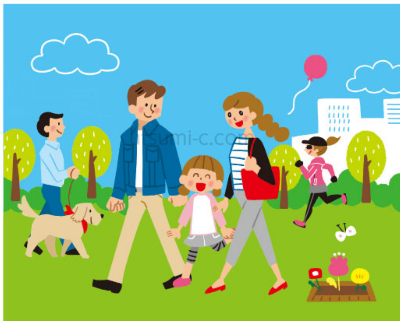
保険会社医療保険パンフレット