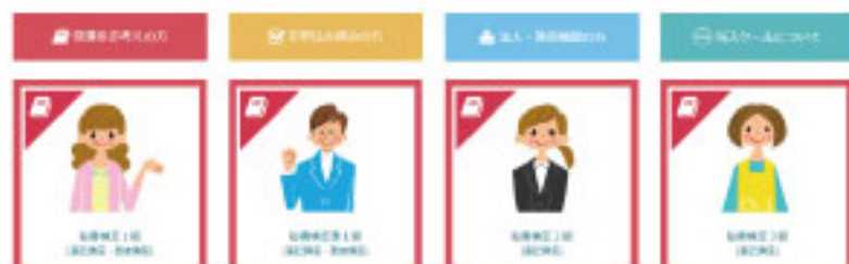
早稲田ワーキングスクール Web サイト