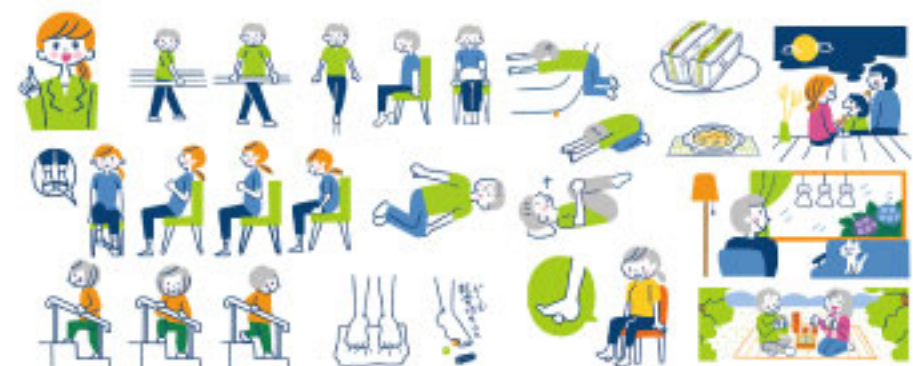
翔泳社「みんなで書き込みやすい 介護カレンダー 2019」