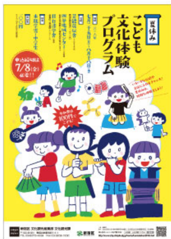
新宿区「夏休み子ども文化体験プログラム」ポスター等