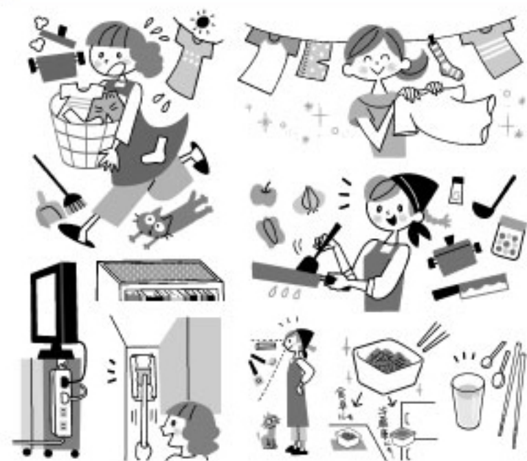
PHP 研究所「くらしらく〜」特集イラスト