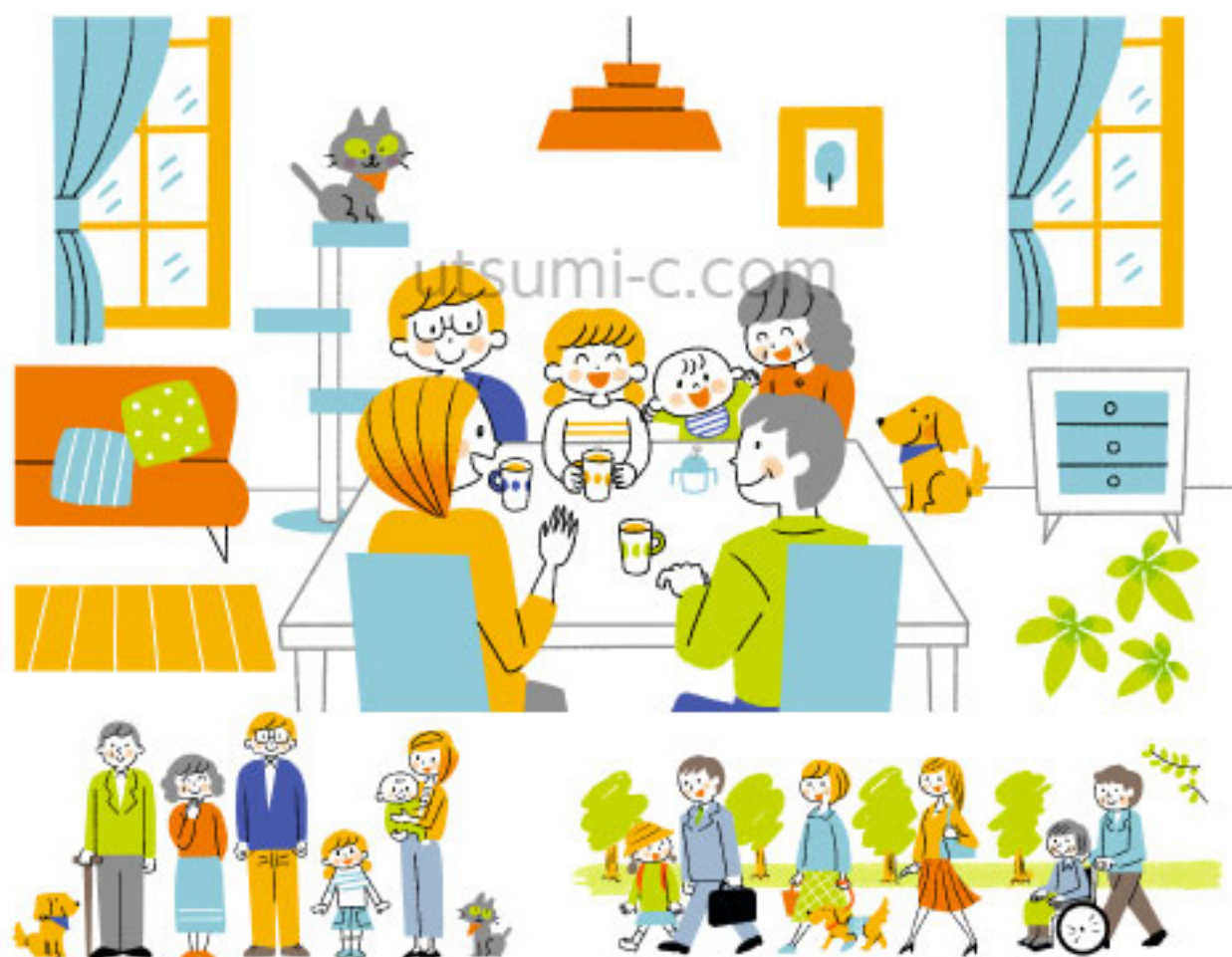
ユニ・チャーム「マイスタイル防災」Web サイト